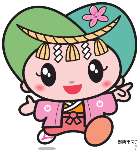
御所市マスコットキャラクター 『ゴセンちゃん』

ご不明な点は、 保証協会 保証支援部 (0742-33-0552) または 御所市農林商工課 (0745-62-3001) までお問い合わせください。