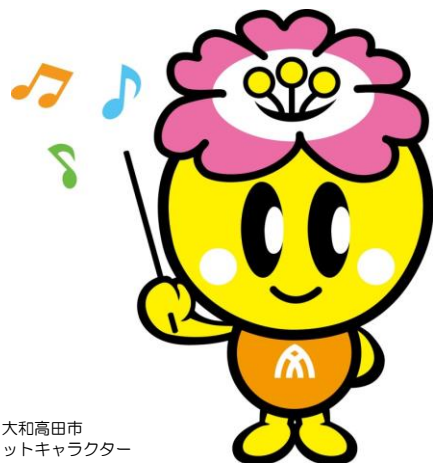
大和高田市 マスコットキャラクター 『みくちゃん』 「許可番号12号」